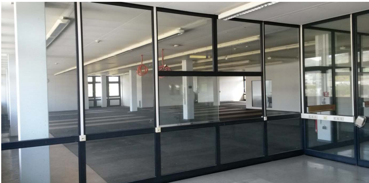
Bild - Ehemalige Bibliothek im 4. OG des IAC